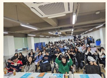
전체 활동 사진