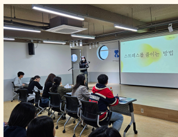
학생 발표 사진2